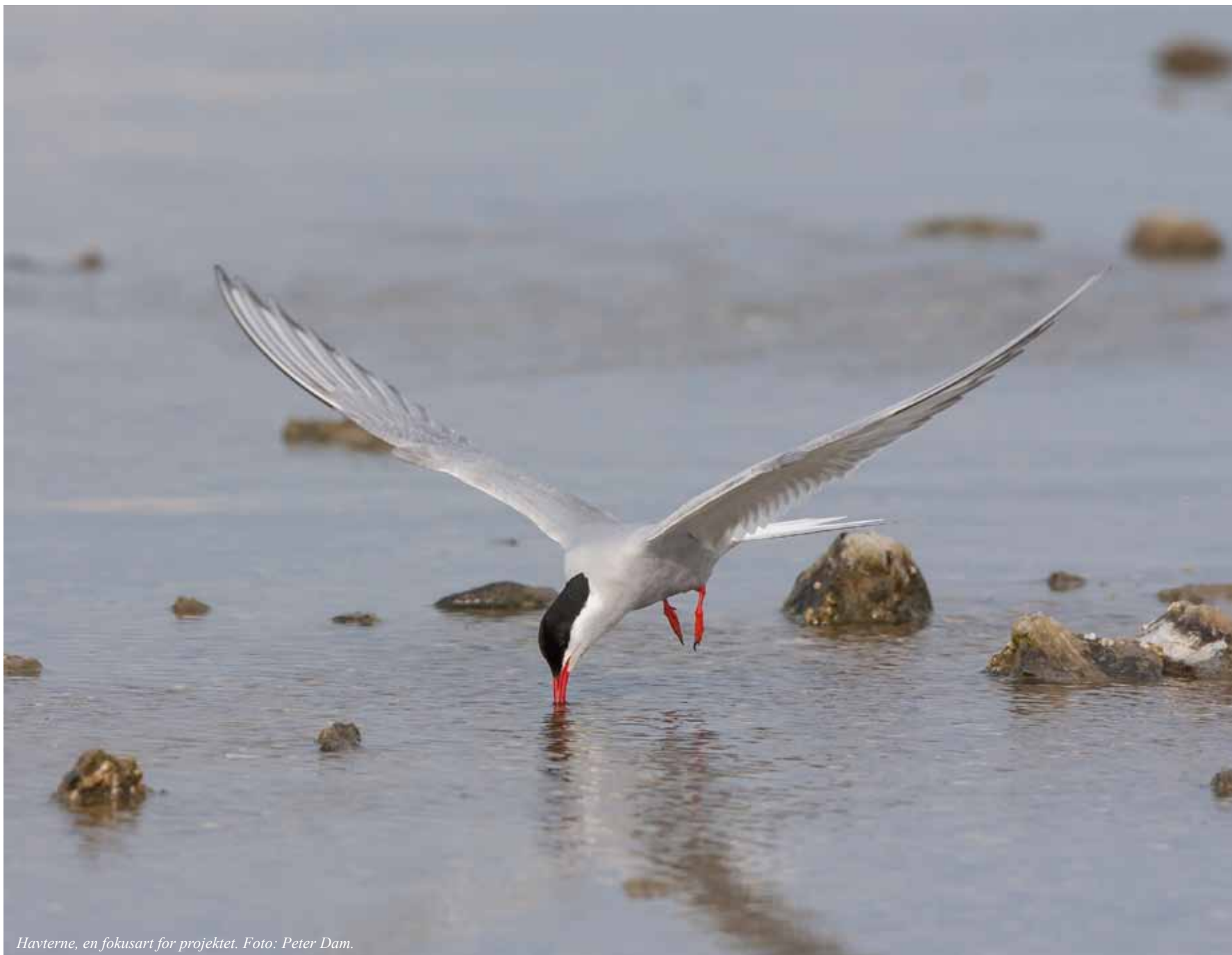
Havterne, en fokusart for projektet.