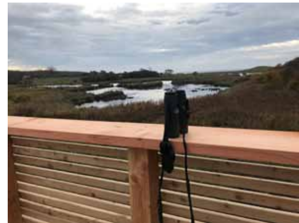
Udsigt mod syd over Gulstav Mose. Godt udsyn og rig mulighed for afsætning af diverse under obsen.

Fra 2012- 2018 har Fugleværnsfondens naturreservat Gulstav Mose på Sydlangeland indgået som en del af EU LIFE-projektet Rare Nature med Faaborg-Midtfyn Kommune som projektleder. I projektet er 18 lysåbne våde naturområder blevet sikret og forbedret på Langeland, Fyn og i Midtjylland. Gulstav Mose indgår med rijkær og den sjældne og prioriterede naturtype: kalkrig mose med hvas avneknippe. Projektet finansieres af EU LIFE+ samt projektparterne og Villum Fonden. Med til projektet hører også opførelse af et nyt fugletårn i Gulstav Mose, designet af Tobias Jacobsen, og med yderligere tilskud på 100.000 kr. fra Grosserer Schielerup og Hustrus Fond 1. Tårnet er netop færdiggjort og tilgængeligt for offentligheden.