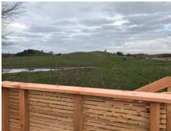
Udsigten mod nord over Ørnehøj. Fine muligheder for at følge med i det sydgående fugletræk om efteråret.

Adgangsforholdene til tårnet er klart forbedret. Trappen op går ad 30 brede trin, og den er ikke så stejl som tidligere. Det er muligt at støtte sig til gelænder og afskærmning på begge sider af trappen. Tårnets beklædning sikrer, at brugerne kan færdes sikkert op og ned. Ligesom man næsten uset kan gå op i tårnet. Når man har nået toppen, møder man et stort stabilt trædæk. Dækket er