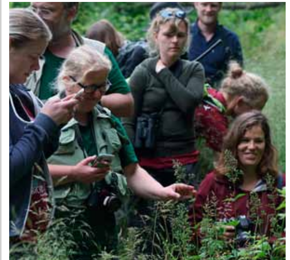
Bioblitzere i Svartingedal.

Det er imidlertid også Fugleværnsfondens ønske at passe godt på fuglene og naturlivet i området. Al formidling har derfor til formål at give besøgende indblik i Svartingedals værdifulde natur, og hvorfor det er så vigtigt at passe på den. Blandt andet derfor holdt Fugleværnsfonden BioBlitz i juni med fund af mange forskellige og spændende arter, heriblandt den supersjældne blødvinge Malthinus seriepunctatus , kun fundet en gang før i landet.