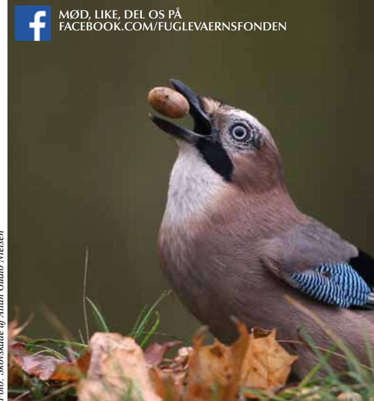
Foto: Skovskade