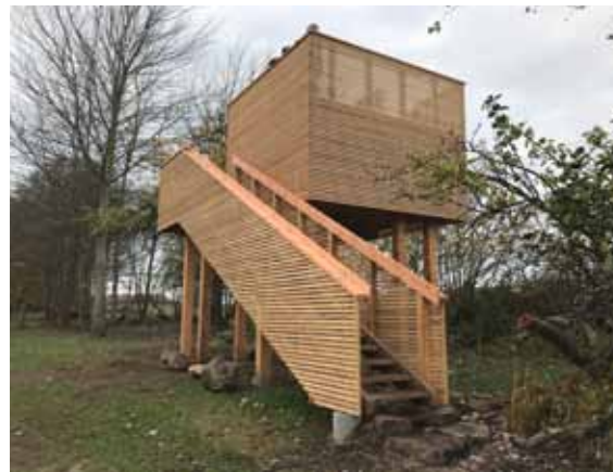
Oppe i tårnet er man også godt skjult. Bemærk de to mennesker i tårnet.

Der venter helt sikkert gode oplevelser til de kommende brugere af tårnet. Mit første besøg på mortensaftensdag, gav ikke det store. En flok knar- og gråender frydede sig dog over, at de lå i mosen - og ikke i ovnen. Men når foråret melder sig, og rørdrummen pauker, de grønne frøer kvækker og fuglene synger - så bliver der fuldt hus i det nye "koncerthus".